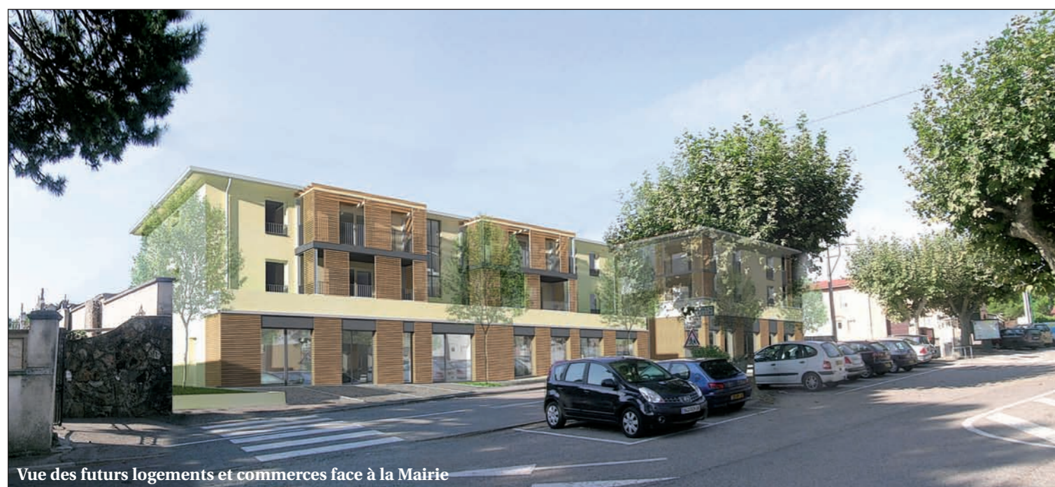
Vue des futurs logements et commerces face à la Mairie

A terme, 40 places de stationnement seront créées sur la place de la Mairie. Le parking des écoles possède 60 places, celui devant le restaurant scolaire 15 places et la nouvelle salle aura son propre parking de 250 emplacements.