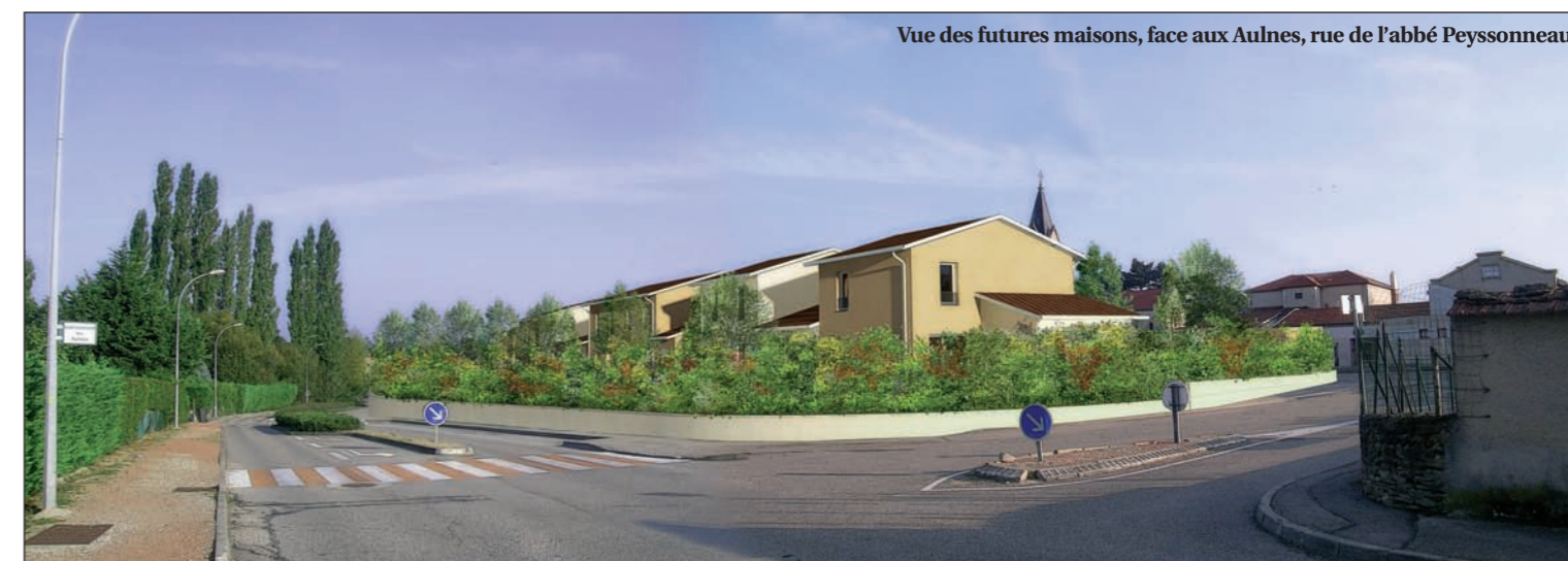
Vue des futures maisons, face aux Aulnes, rue de l'abbé Peyssonneau

Le dépôt du permis de construire sera réalisé courant novembre 2009.